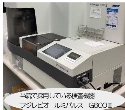
当院で採用している検査機器 フジレビオ ルミパルス G600 II